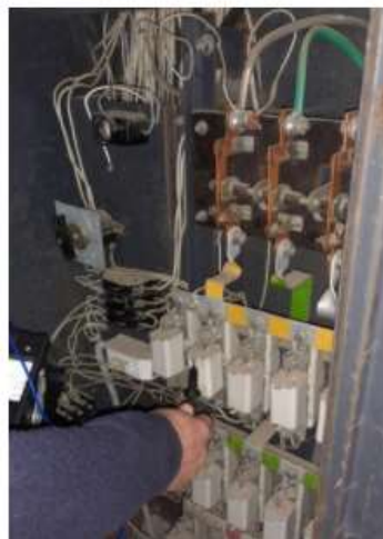
25.11.2021 Восстановление освещения в подвальном помещении. Ремонт выключателя. г. Пушкин, Оранжевая ул. 67/31 #жкк1пушкин