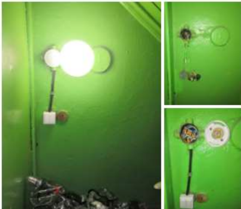
17.11.2021 Обработка входной двери г. Пушкин, Пушкинская ул. 54 #жко2пушкин