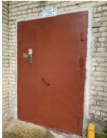
17.11.2021 Восстановление освещения г. Павловск, Динамо, Пионерская ул. 6 #жко2пушкин