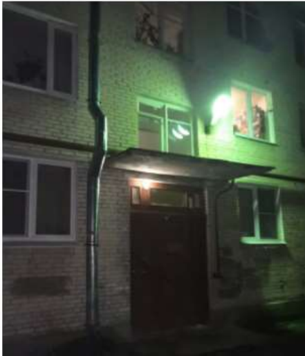
15.11.2021 Замер изоляции г. Пушкин, Набережная ул. 10/61 #жко2пушкин