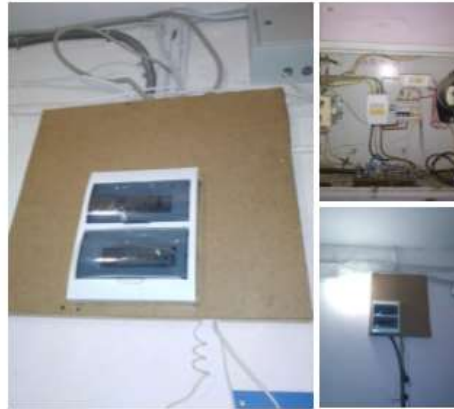
11.11.2021 Установка светильника г. Пушкин, Малаховская ул. 69 #жко2пушкин