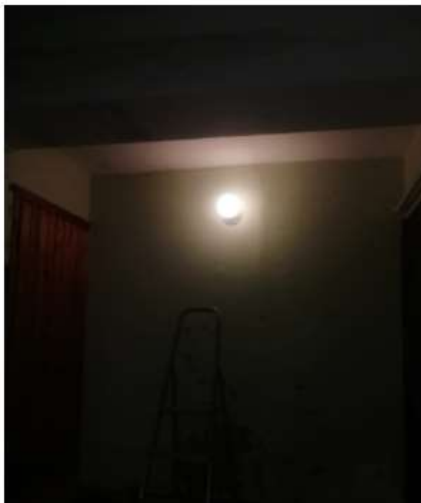
19.11.2021 г. Павловск, Берёзовая ул. д. 6 кв 18 замена автомата. #жкк2пушкин