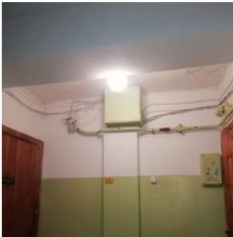
29.11.2021 Восстановление освещения над входом в парадное г. Павловск, Васнецов ул. 13 #жко2пушкин