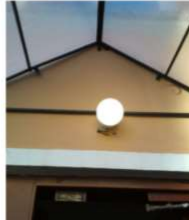
12.11.2021 Установка светильников НББ г. Пушкин, Ленинградская ул. 69 #жко2пушкин