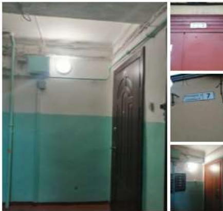
15.11.2021 Восстановление освещения г. Павловск, Гуммолосаровская ул. 7 #жко2пушкин