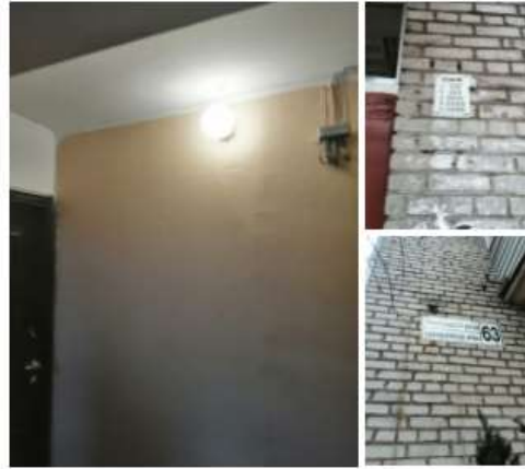
16.11.2021 Восстановление освещения г. Пушкин, Лавотьевское ул. 11 #жко2пушкин