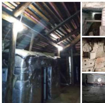
25.11.2021 Восстановление освещения г. Павловск, Гумилевская ул. 7 #жкк2пушкин