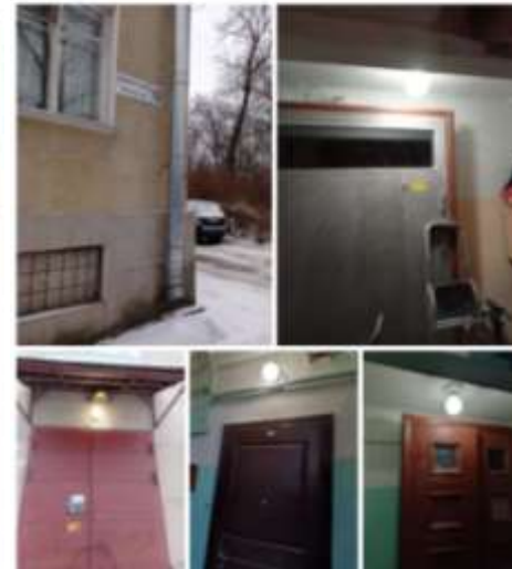
29.11.2021 Освещение подвальных помещений г. Пушкин, Ленинградская ул. 69/81 #жко2пушкин