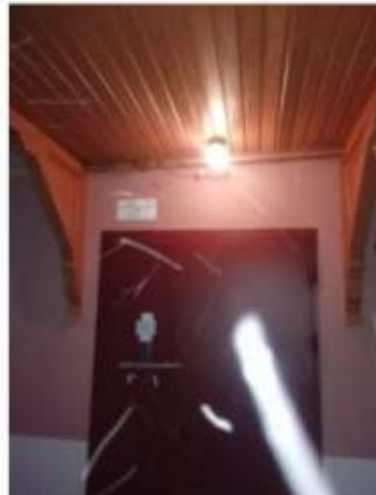
29.11.2021 Восстановление освещения г. Пушкин, Сдростовая ул. 10 #жко2пушкин