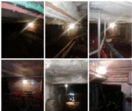
29.11.2021 Освещение подвальных помещений г. Пушкин, Ленинградская ул. 73 #жко2пушкин