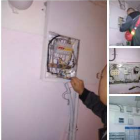
16.11.2021 Восстановление освещения г. Пушкин, Ленинградская ул. д. 63 #жко2пушкин