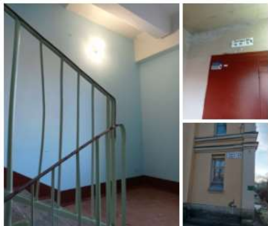
23.11.2021 Замер сопротивления изоляции г. Павловск, Динамо, Новая ул. д. 10 #жкк2пушкин