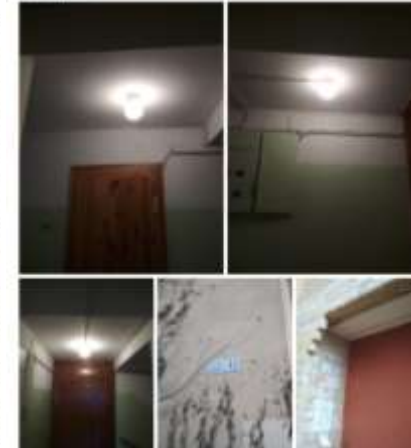
16.11.2021 Ремонт светильника #жко2пушкин