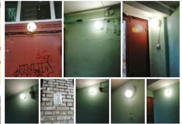
15.11.2021 Восстановление освещения г. Пушкин, Ленинградская ул. 7 #жко2пушкин