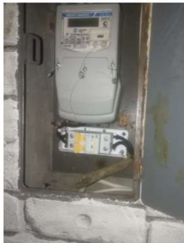
19.11.2021 г. Пушкин, Конюшенная ул. д. 16 замена светильника. #жкк2пушкин