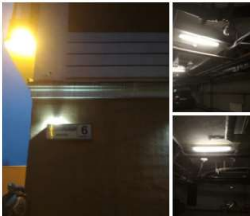
19.11.2021 г. Павловск, Берёзовая ул. д. 19 замена светильника. #жкк2пушкин