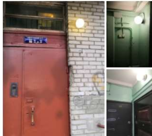
17.11.2021 Освещение чердачного помещения г. Пушкин, Пушкинская ул. д.11 #жко2пушкин