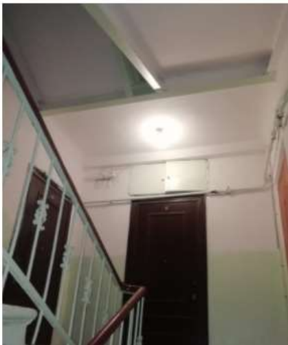
29.11.2021 Восстановление освещения г. Павловск, Лебединая ул. 14/3 #жко2пушкин